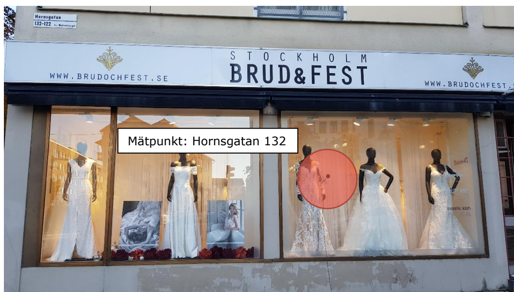
Figur 3 Placering av mätpunkt

Se Figur 1 för mätpunkt i karta samt Figur 3 nedan för foto över mätpunkt.