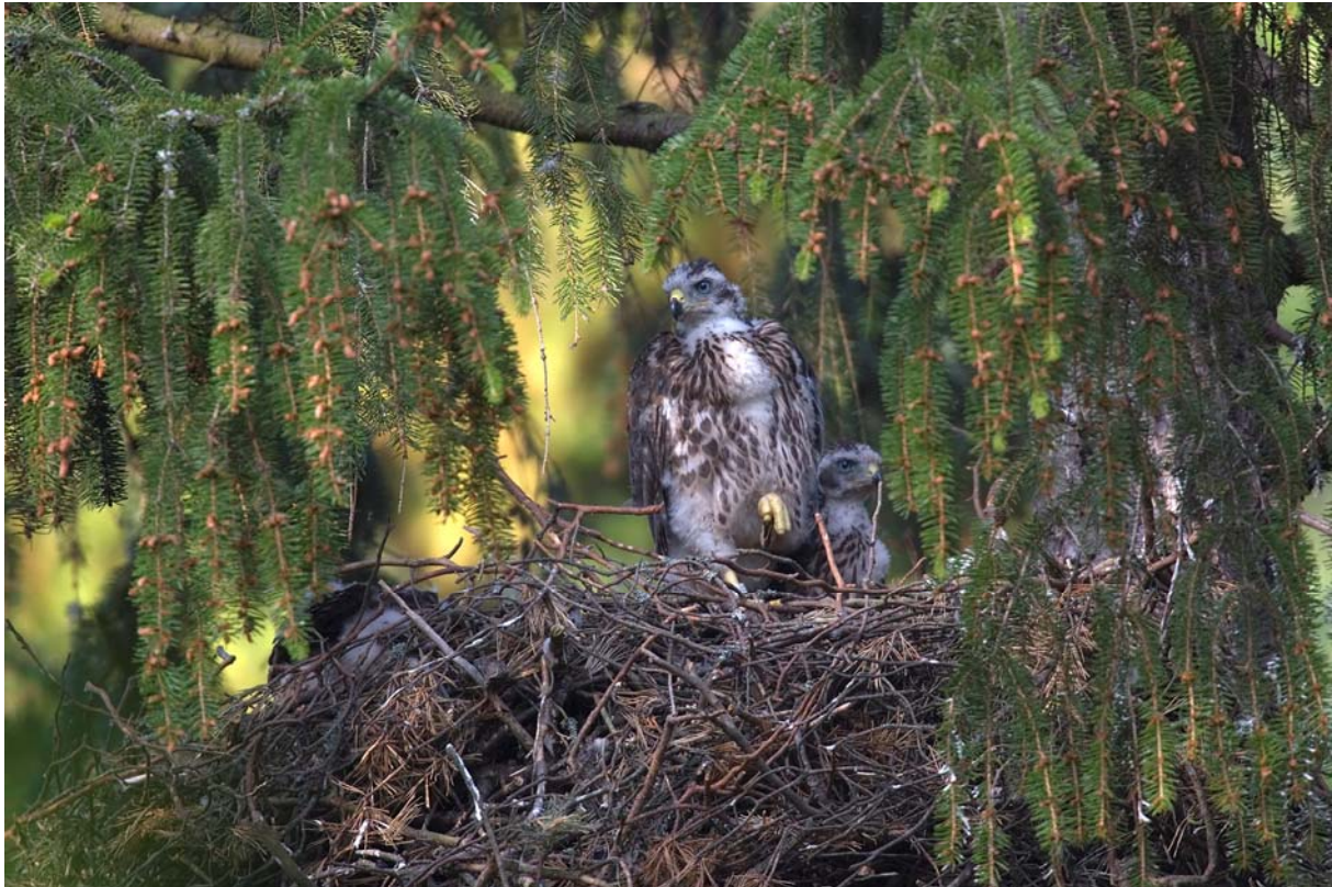
3 snart flygga ungar, ringen skymtar på högerbenet, Bromsten 5 juli 2006. Två ungar är lätta att se, den tredje ligger hopkrupen i boets vänsterkant, under den nedhängande grenen.