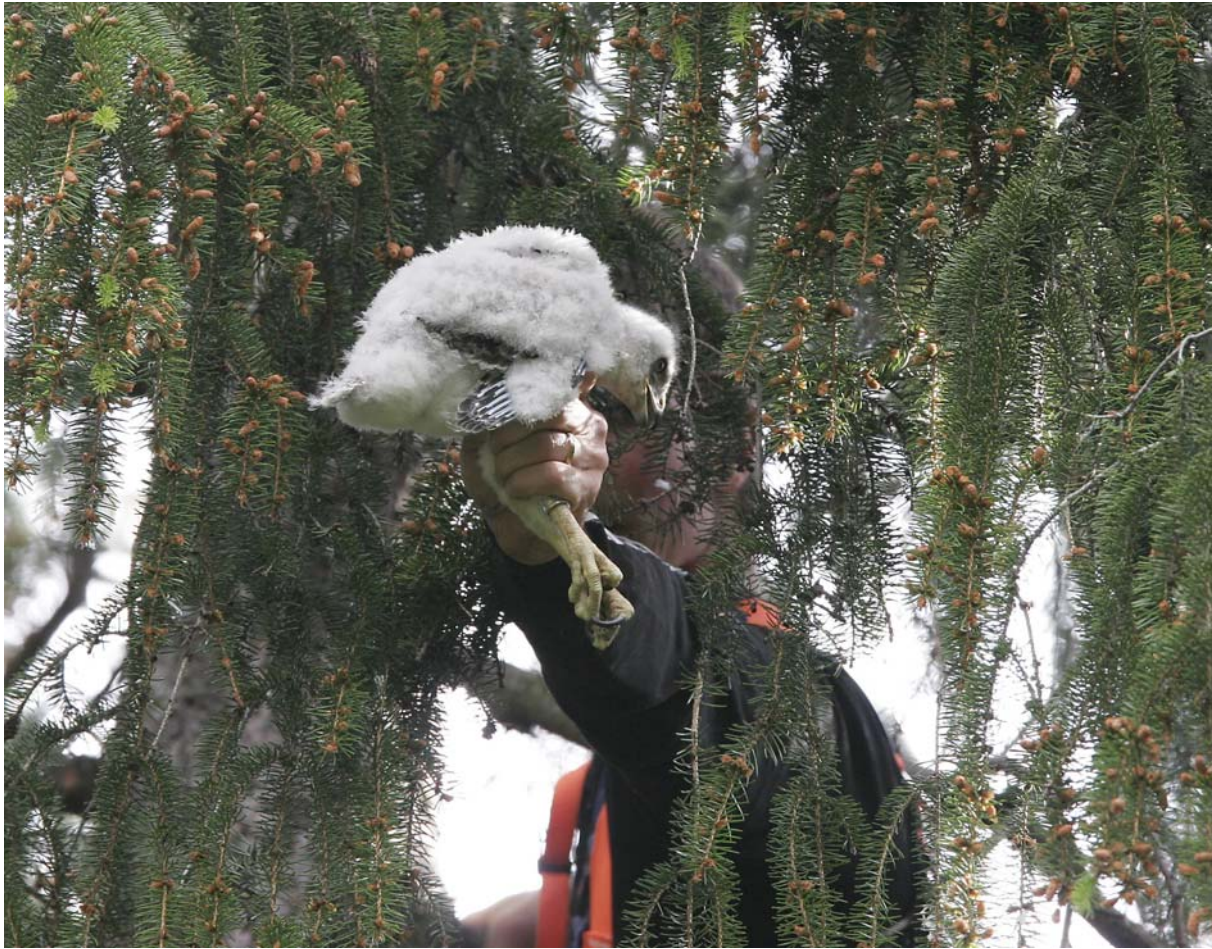
En av tre, Bromsten den 22 juni.

Ringmärkningen har alltid skett uppe vid boet. Det går fortast, d v s störningen vid boet blir så kort som möjligt, men det är även praktiskt bäst. Man slipper skicka ungarna ner och sedan upp igen i någon typ av påse. Klättring har skett med stolpskor.