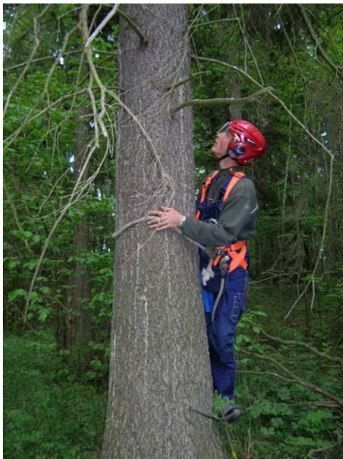
En med torra och förrådiska kvistar bemängd gran.

Två olika storlekar av stolpskor har använts för att komma upp till boet. Stammens grovlek har avgjort vilket par som använts. I något enstaka fall har vi använt en stege för att nå de nedersta grenarna, därefter har vi klättrat på grenarna upp.