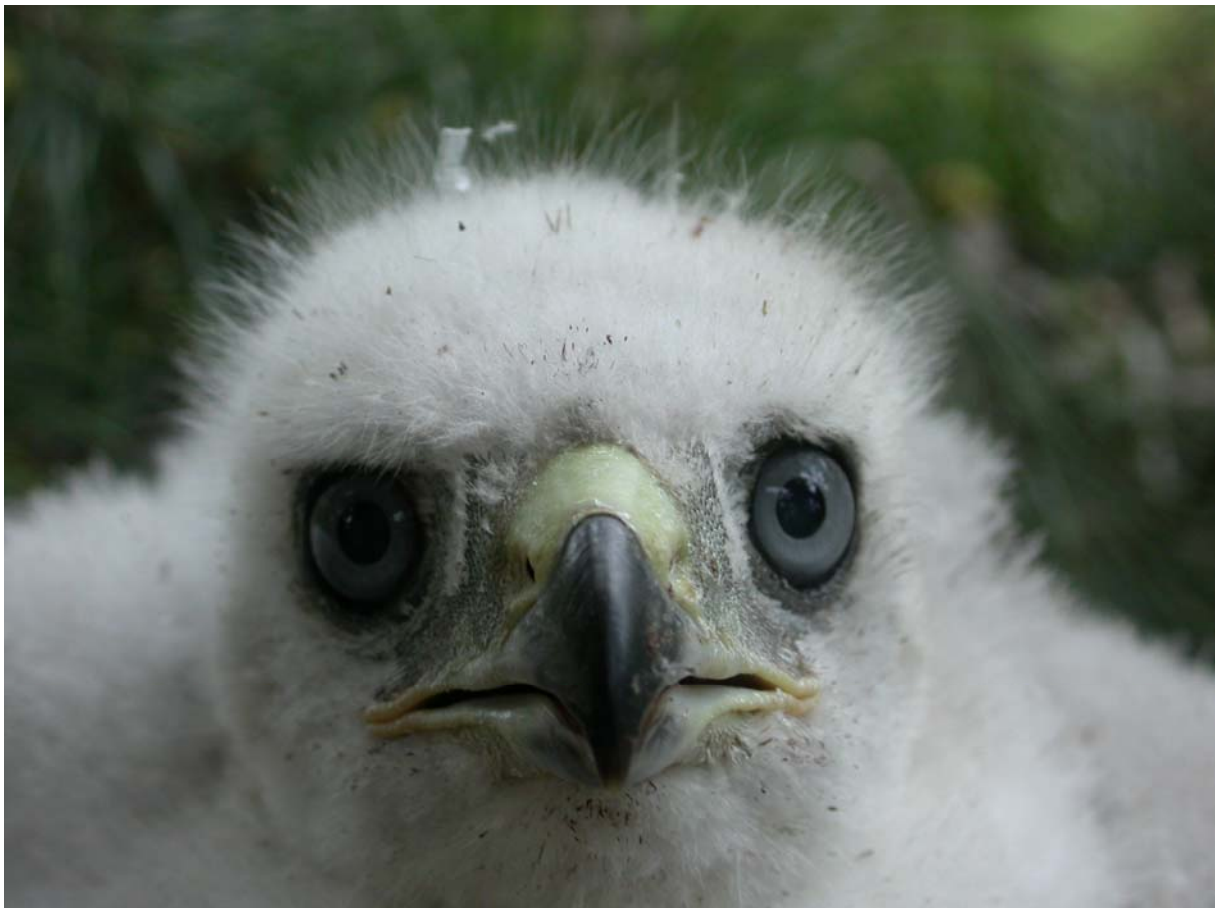
En av ungarna på södra Djurgården.

Antalet möjliga häckplatser är troligen en begränsande faktor för populationens storlek. Detta stöds av den höga produktionen ungar trots att populationen är tätare än i övriga landet.