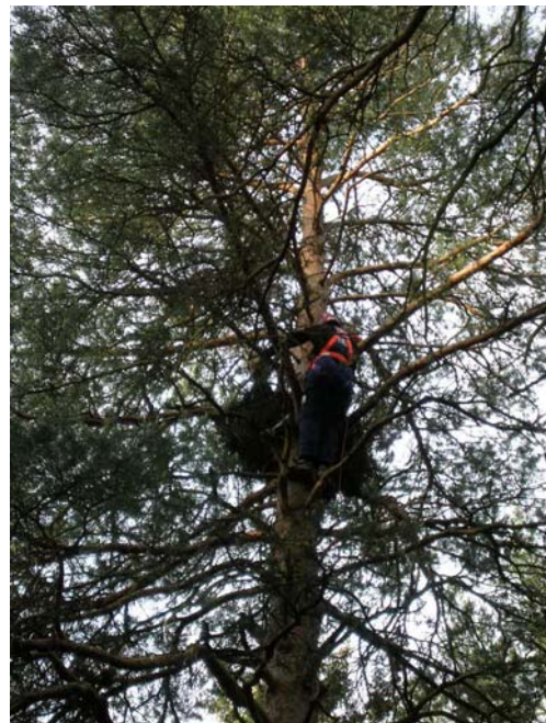
Tillbakkalutad ringmärkning 16 meter upp i tall.