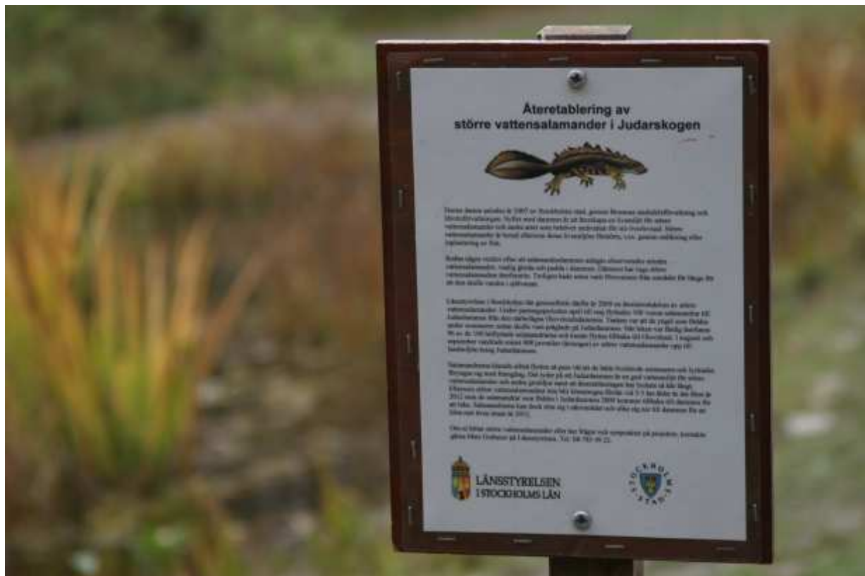
Fig 1 En av de två informationsskyltarna om återintroduktionen vid Judardammen.

Två informationsskyltar om återintroduktionen togs fram och sattes upp vid Judardammen i mars 2010. Skyltarna har klarat sig utan skadegörelse eller annan åverkan.